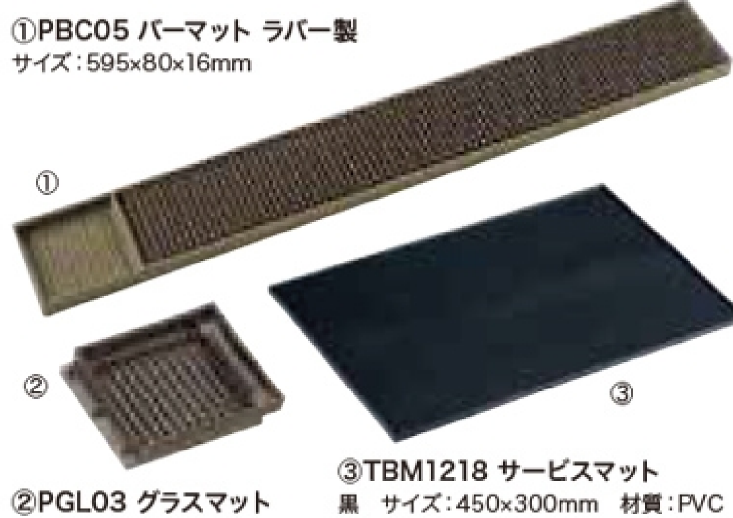
①PBC05 パーマット ラバー製 サイズ:595×80×16mm