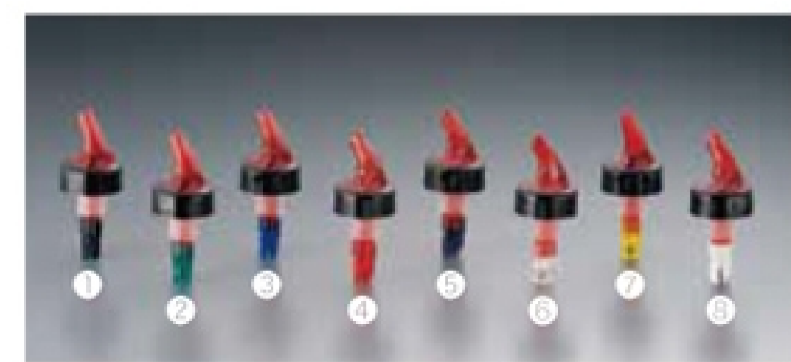
メジャーポアラー(ウイスキー用) ①701ブラック(18cc) ②702グリーン(22cc) ③ブルー(26cc) ④704レッド(30cc) ⑤705パープル(33cc) ⑥クリアー(37cc) ⑦707イエロー(45cc) ⑧ホワイト(60cc) ※①-⑧ABS樹脂/EVAポリカーボネイト