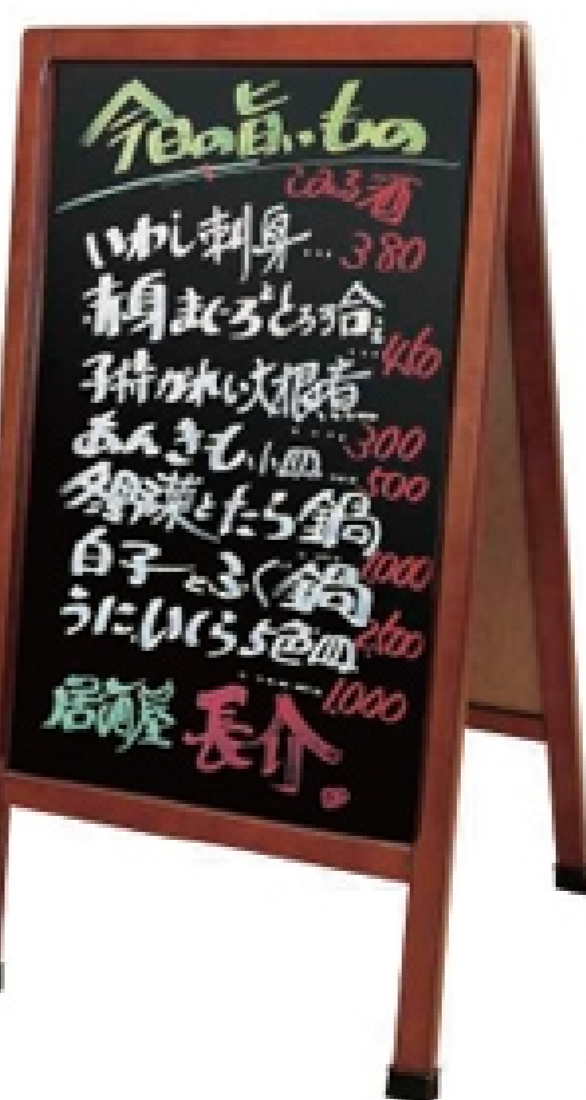
ES7 A型看板 材質:木フレーム シート貼加工 サイズ:W52×H110cm