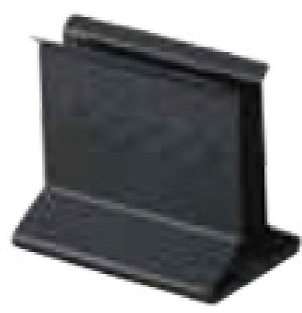
SE-12 メニュースタンド 黒 サイズ:120×75×H105mm/幅1mm 材質:金属製