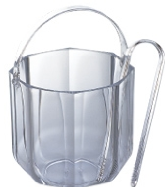
アイスペール トング付 サイズ:W135×H190mm 材質:アクリル