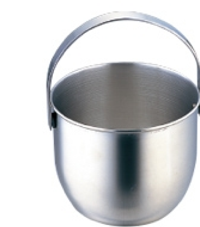
アイスペール サイズ:124φ×H180mm 材質:ステンレス