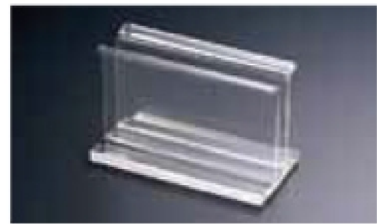
PMN-BA アクリルスタンド サイズ:120×60×H75mm/幅15mm 材質:アクリル製