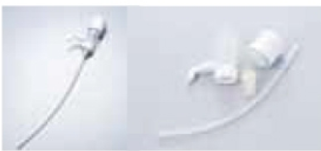
ワンプッシュ定量ディスペンサー「一押しくん」 簡単で正確に定量15~30ml注げます。味、品質が常に安定します。パーツは簡単に外せて洗浄もできるので衛生的です。