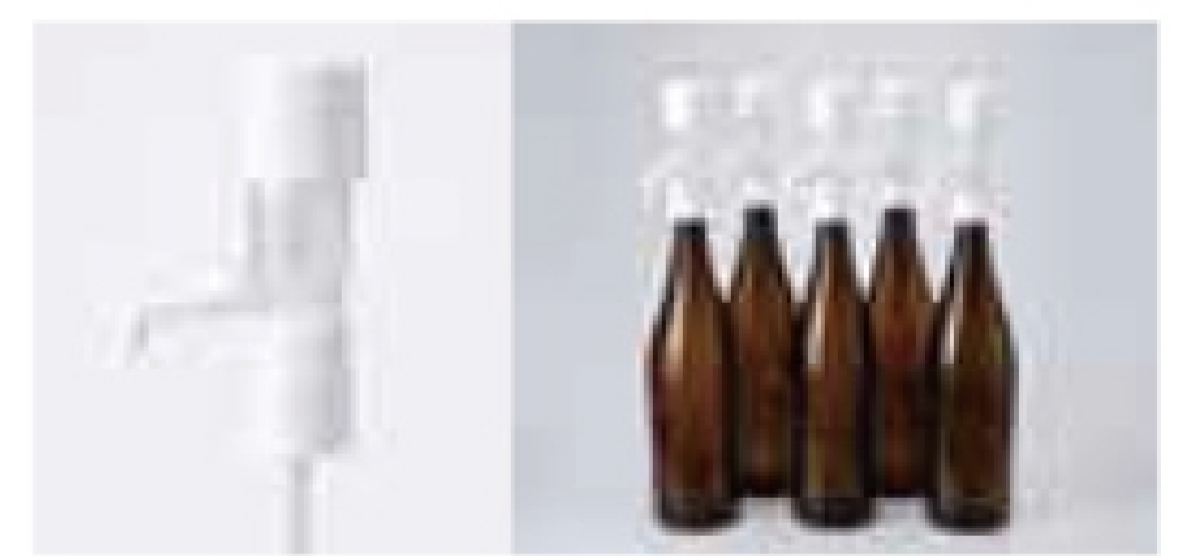
ワンプッシュ定量ディスペンサー「一押しくん」瓶用 簡単に正確に15~30ml注げます。一升瓶、リキュール瓶に対応可(ボトル口径34mm以下に対応) このラインまで押すと15ml抽出の目安になります。