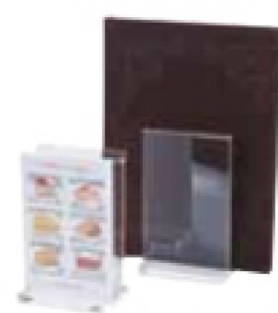
PMN-GK 縦型スタンド大 サイズ:100×70×H163mm/幅21mm 材質:アクリル製