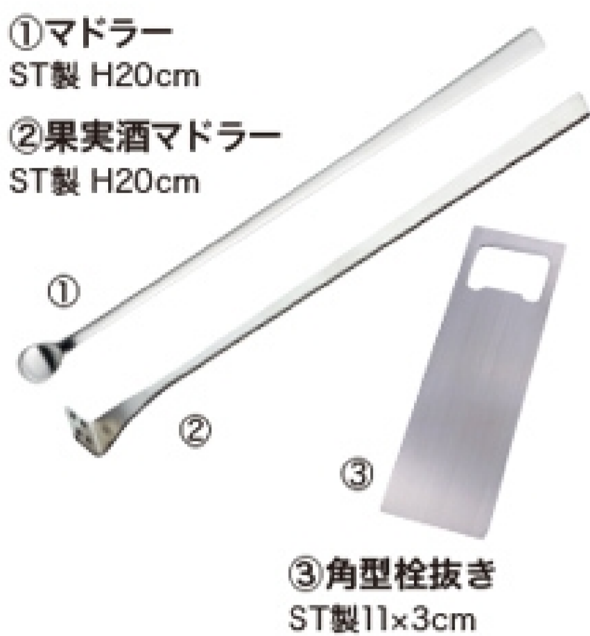
①マドラー ST製 H20cm ②果実酒マドラー ST製 H20cm ③角型栓抜き ST製11×3cm