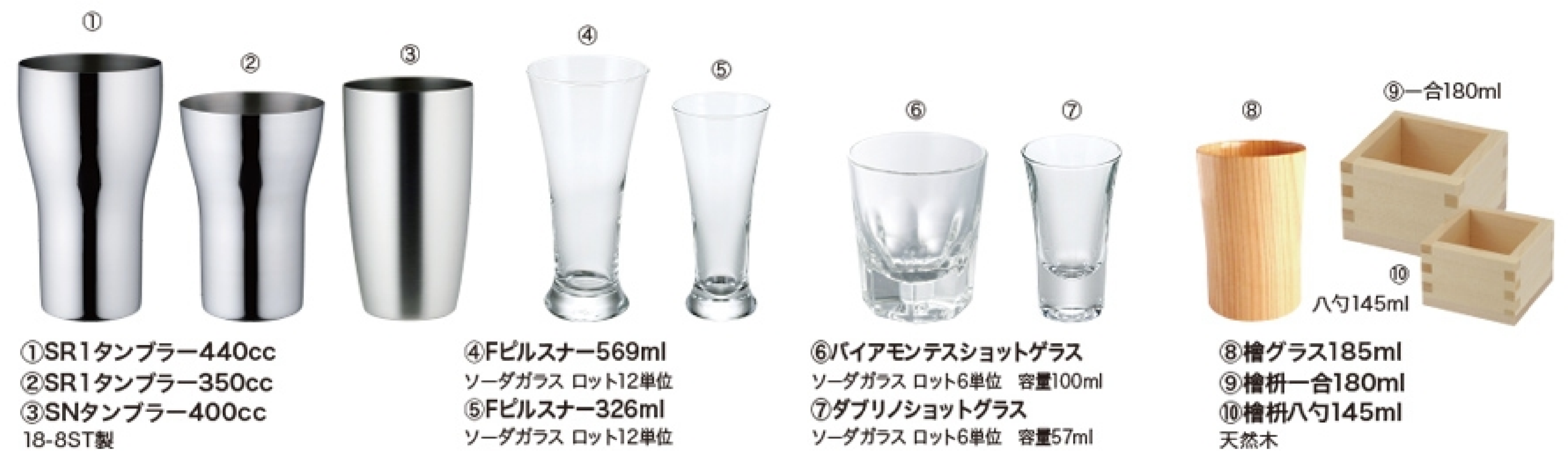
①SR1タンブラー440cc ②SR1タンブラー350cc ③SNタンブラー400cc 18-8ST製