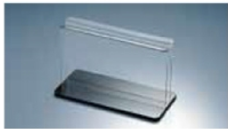
07901 横型スタンド大 サイズ:170×80×H110mm/幅16mm 材質:アクリル製