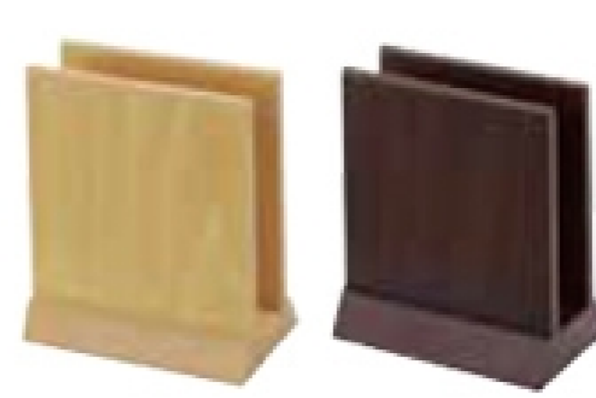
PBT-G1 木目スタンド サイズ:100×60×H115mm/幅25mm 材質:クロス素材貼製