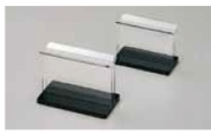
PBTB7 アクリルスタンド 大サイズ:115×60×H84mm/幅12mm 小サイズ:98×50×H74mm/幅7mm 材質:金属製