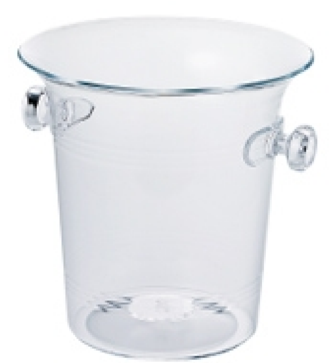
ワインクーラーL サイズ:210φ×H225mm 材質:アクリル