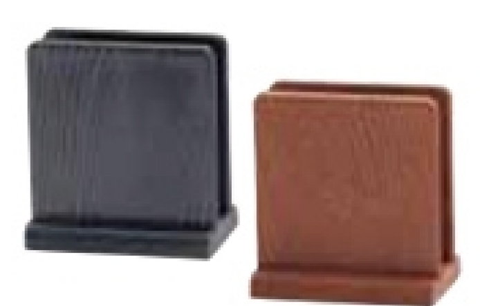
M44-16メニュースタンド黒/茶 サイズ:110×70×H120mm/幅15mm 材質:ABS製