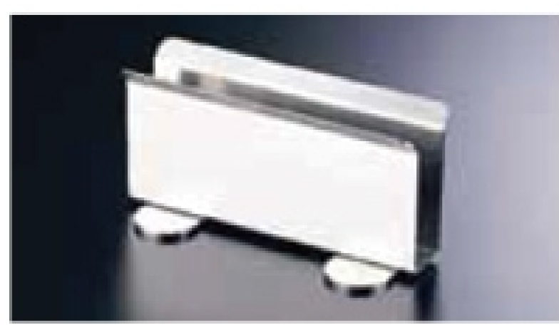
RK18-8 メニュースタンド サイズ:120×55×H60mm/幅1mm 材質:金属製